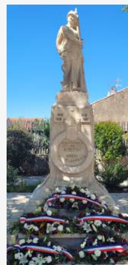
Rognac : dépôt gerbe par Michel Lorenzini