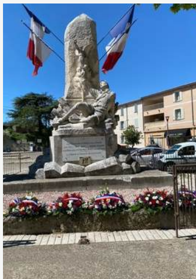
Tarascon : dépôt de gerbe le 8 mai par le compagnon Jean-Pierre Perez