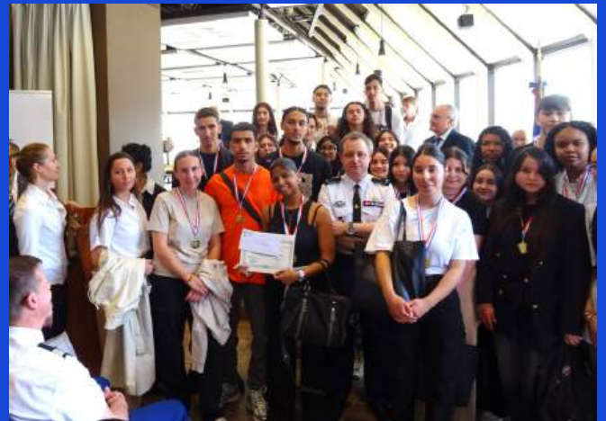
Collège André Malraux